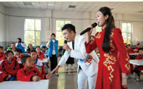
二人台对唱《挂红灯》