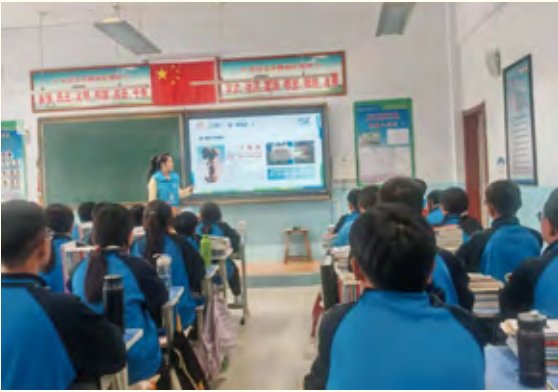
和林格尔县第一中学作宣讲