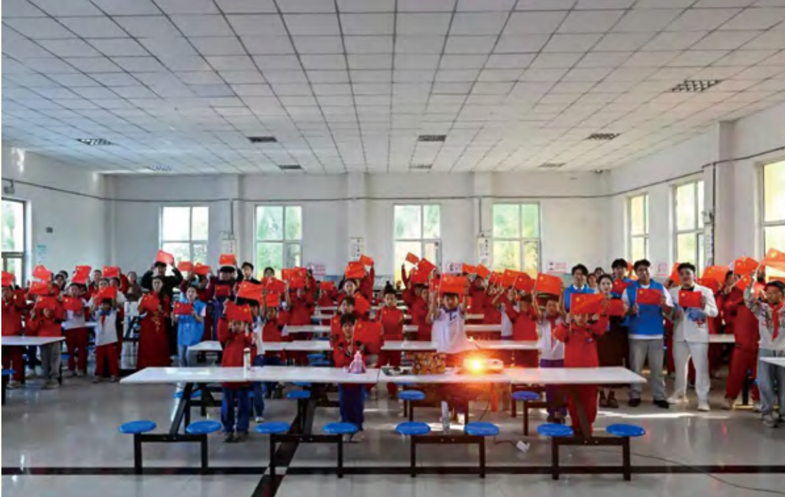
大小学生合唱《我和我的祖国》