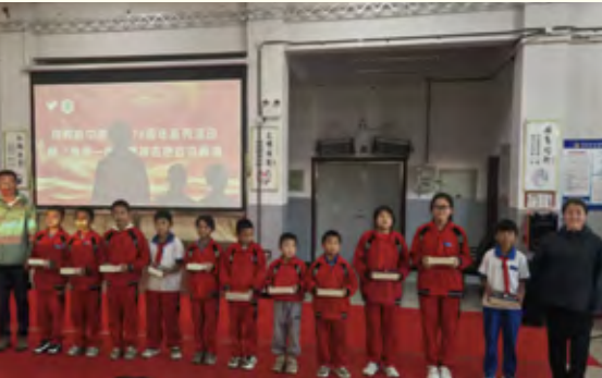
向栽生小学捐赠学习用品

宣讲结束后，我校宣讲团成员（校广播站成员）与和林格尔县第一中学学生共同播报晚间校园广播，两校学子以广播为纽带，共同回顾了国庆节所承载的，从开国大典上“中国人民从此站起来了”的庄严宣告，到今日国家繁荣、民族复兴壮丽画卷的民族记忆与国家荣耀。