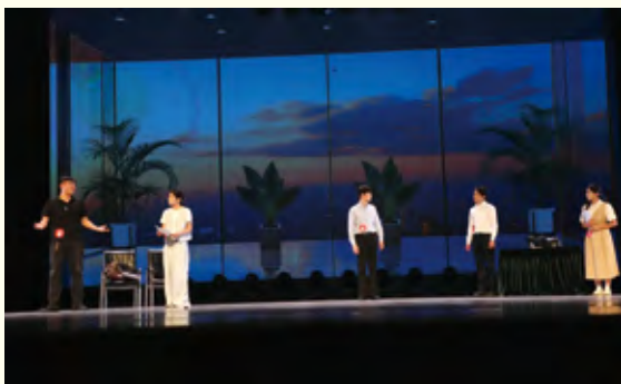
《总裁的法律启蒙》情景剧演出现场