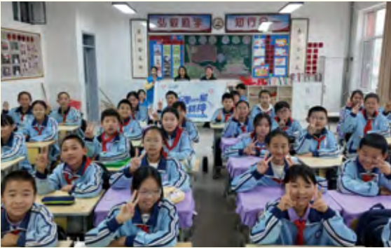
在和林格尔县第五小学作宣讲