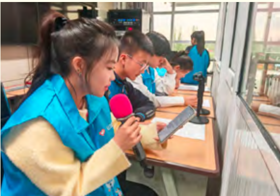
共同播报晚间校园广播