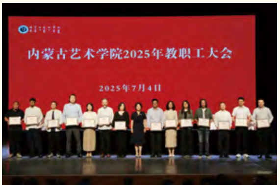
荣获2024年度高质量科研和艺术创作展演成果的教师