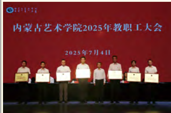
荣获2024年度优秀处级领导班子的部门和单位