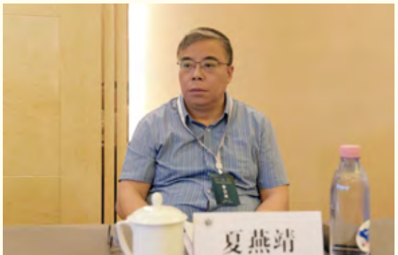
上海交通大学人文学院特聘教授夏燕靖