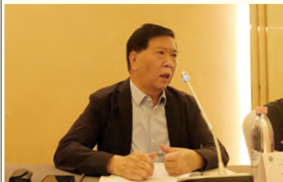
首都师范大学左东岭教授