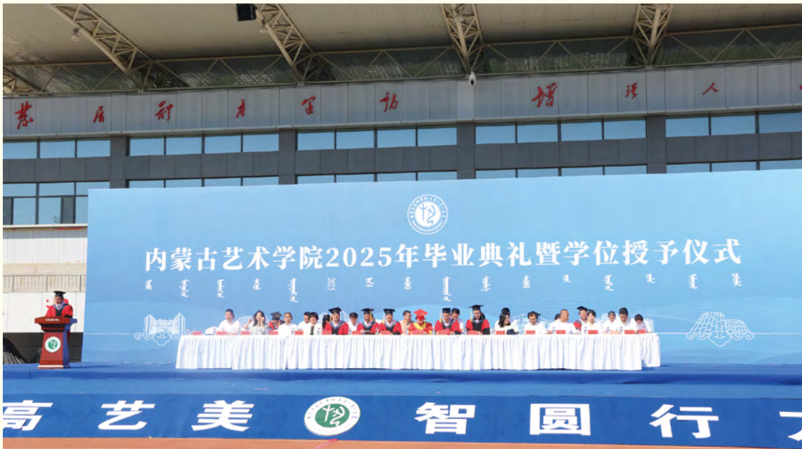
我校2025届毕业生毕业典礼暨学位授予仪式现场

约定他日繁花再聚。亲爱的2025届毕业生们，愿你们带着草原的辽阔胸襟、艺术的赤诚之心，向美而行，让青春在祖国的万里山河间绽放璀璨光芒！此去山高水长，母校永远是你们最温暖的港湾，最坚实的后盾！（李雅茹）