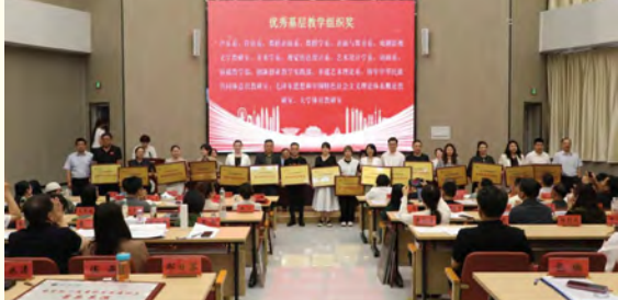
国家级一流本科专业建设点获奖表彰