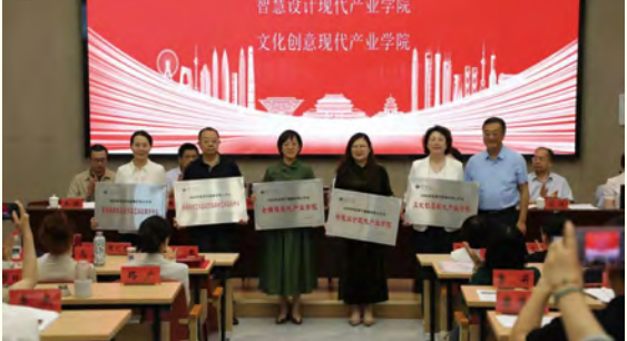
优秀实践育人平台、优秀产教融合育人平台获奖表彰