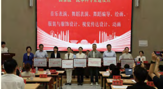
国家级一流本科专业建设点获奖表彰