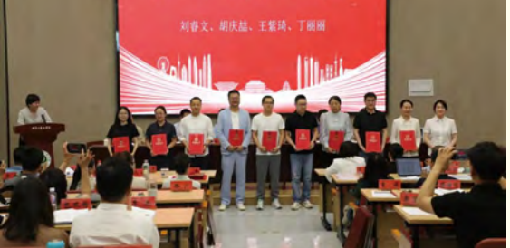
优秀教学成果奖获奖表彰