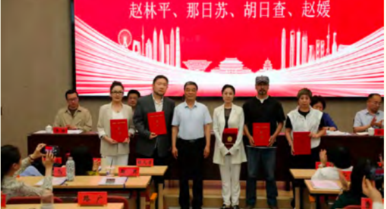
国家级教学成果奖、国家级一流本科课程负责人获奖表彰