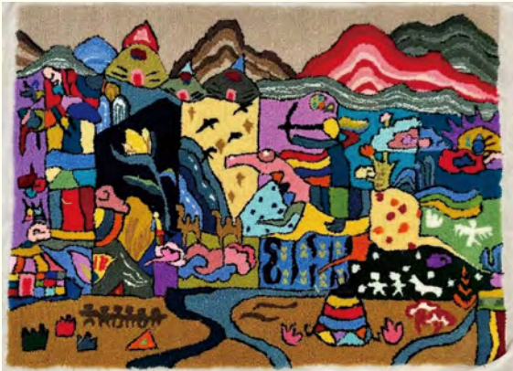
《乐》 (2021级公共艺术) 黄辉