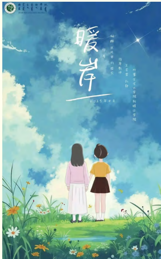
动画《暖岸》海报 作者：武风苗、刘圆乐、胡群

本次毕业展览以“赓续文脉·创新发展”为主题，共展（映）出了2021级动画、动画（漫画）、数字媒体艺术等专业和专方向127名学生的48套（组）精选作品。新媒体学院的毕业生们以呼伦贝尔市得天独厚的文化资源为灵感源泉，运用新媒体艺术手段，创作出动画、数字媒体、漫画及衍生品等一系列丰富多彩的艺术作品。这些作品以草原为底色，以非遗传承、民族艺术为纽带，开展数字艺术探索，多元呈现了呼伦贝尔的自然之美与文化之韵。