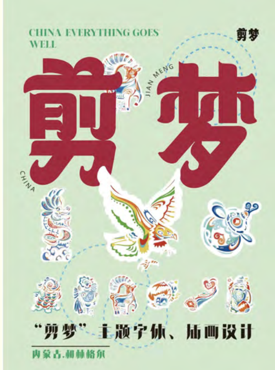
《剪梦》 (2021级视觉传达设计) 李林荣