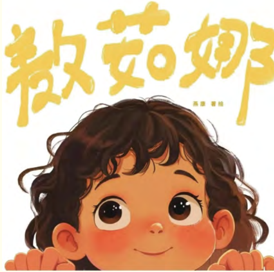
绘本《救茹娜》 作者：祁子凤