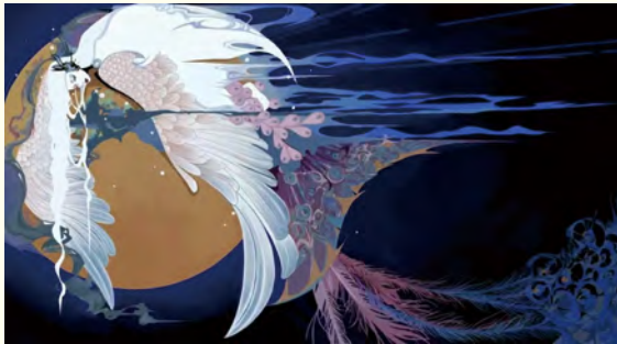
《思念》 (2021级公共艺术) 董子依