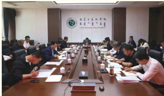
中心组学习会议现场

本报讯 4月24日下午，我校在云谷校区行政楼1号会议室举办深入贯彻中央八项规定精神学习教育读书班(第2期)暨党委理论学习中心组学习会议，主要任务是深入学习贯彻习近平总书记关于作风建设的重要论述，全面落实党中央关于全面从严治党、统战工作及网络行为规范的决策部署，跟进学习习近平总书记的