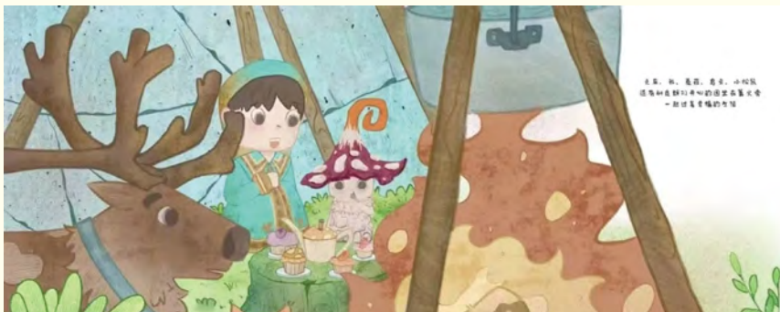
绘本《乌云》内页 作者：冯霄