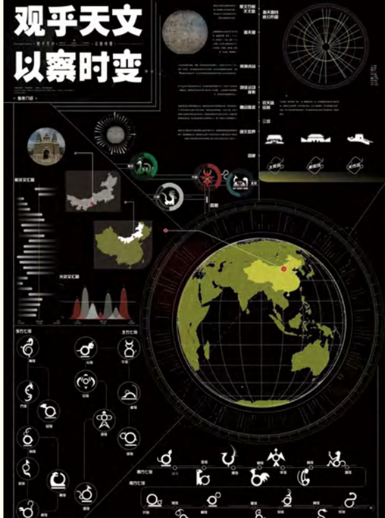
《观乎天文以察时变》 (2021级视觉传达设计) 吕域城