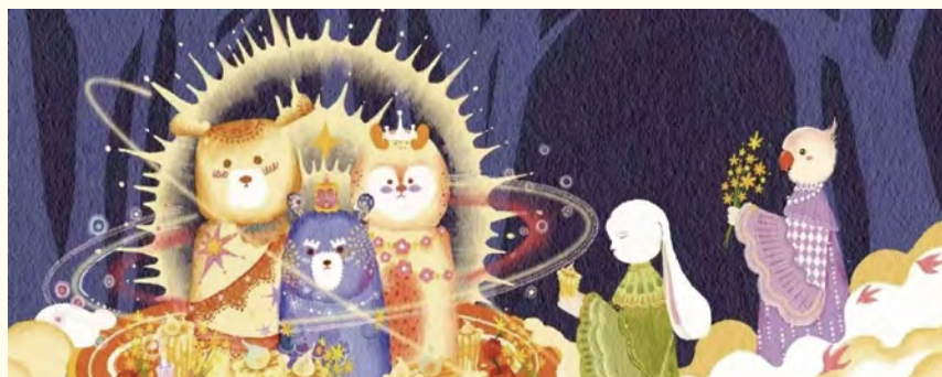
绘本《有鹿的地方》内页 作者：杨素青