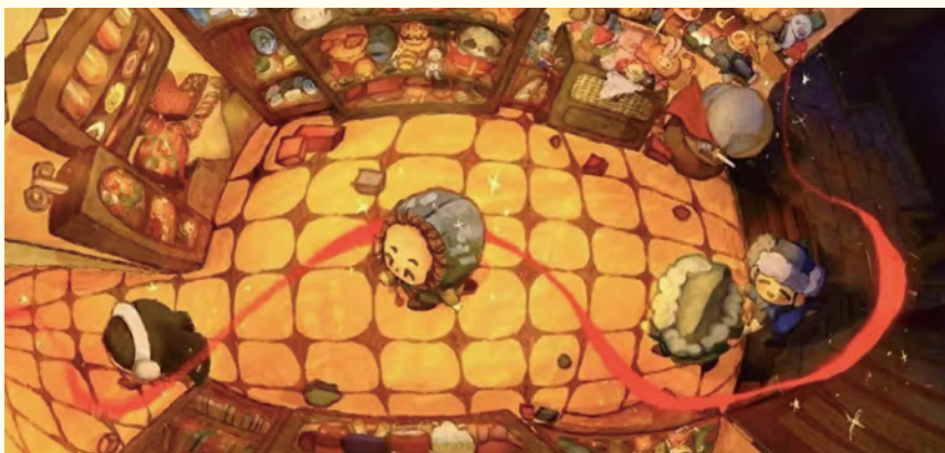
《请看向我》内页 作者：王子涵