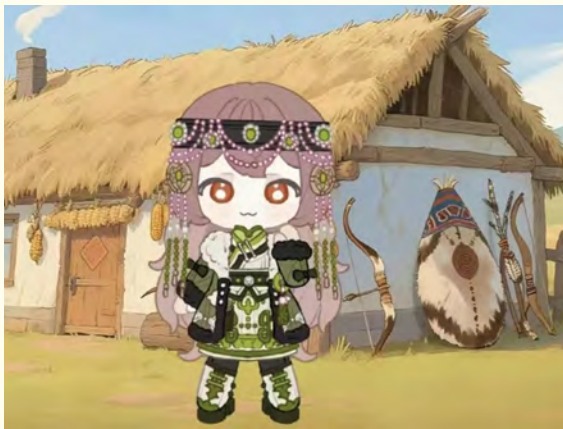
数字人设计《达娅》 作者：阿奇、王楠、刘哲