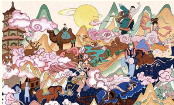
《丝路长歌》 (2021级公共艺术) 黄蒙