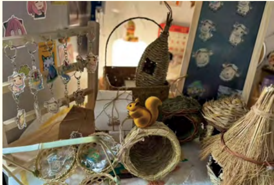
《编韵泉阳》 (2021级艺术设计学) 吕子翀

本次毕业设计作品展以“创·无界”为主题，象征着设计之无界，创意之无限。学生们立足学科专业前沿，关注民生与社会发展，为生活而艺术，为民生而设计。展览呈现了服装与服饰设计、表演（服装设计与表演）、公共艺术、环境艺术设计、艺术设计学、视觉传达设计6个本科专业167名毕业生的作品，围绕“创意内蒙古，设计在北疆”，聚焦赋能乡村振兴、AI赋能、跨媒介融合等多领域，旨在通过设计的语言，彰显内蒙古深厚的文化底蕴，展现毕业生们对家乡的深情与对创新的不懈追求。展览中的每一件作品都凝聚着毕业生们的才华与激情，反映出学生们扎实的专业基础、敏锐的时代洞察力和勇于探索的创新精神，他们以独特的视角探索着设计的无限可能。我们相信，在未来的设计之路上，这些年轻的设计人才将继续以创新为笔，以梦想为墨，书写更多精彩篇章，为北疆文化的繁荣和发展贡献更多的智慧和力量。