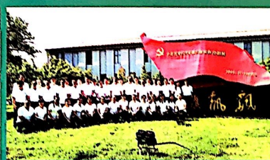
2019年全体党员参观黑龙江省委旧址