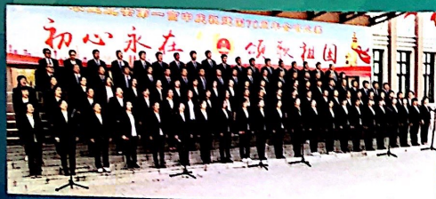
2019年教职员工参加庆祝建国70周年合唱比赛