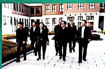
黑河市教育局领导到校检查工作