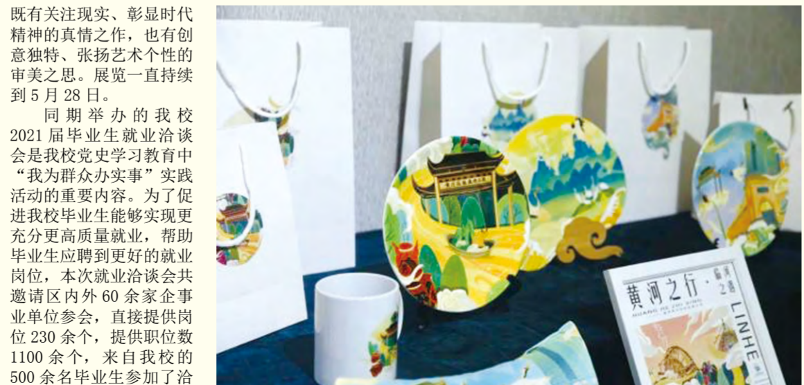
艺术设计 艺术设计学专业 张圆

既有关注现实、彰显时代精神的真情之作,也有创意独特、张扬艺术个性的审美之思。展览一直持续到5月28日。 同期举办的我校2021届毕业生就业洽谈会是我校党史学习教育中“我为群众办实事”实践活动的重要内容。为了促进我校毕业生能够实现更充分更高质量就业,帮助毕业生应聘到更好的就业岗位,本次就业洽谈会共邀请区内外60余家企事业单位参会,直接提供岗位230余个,提供职位数1100余个,来自我校的500余名毕业生参加了洽谈会。