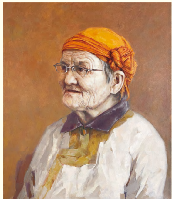
都贵玛老人(油画)100×80cm 孟显波