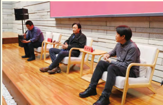
中国戏曲学院新媒体艺术系主任、教授张立,北京电影学院教授、导演耿少波作研讨发言