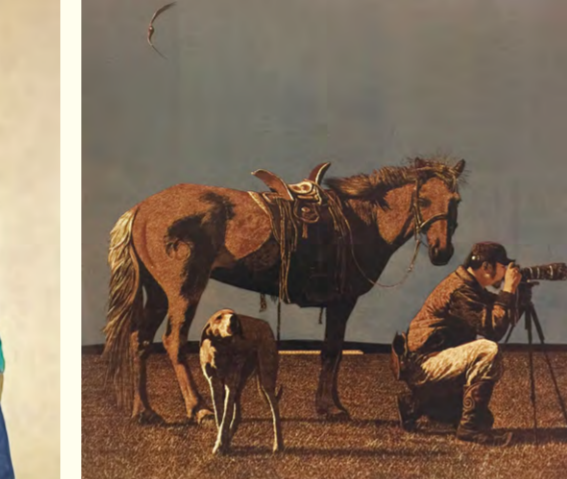
听见草原—聚焦(绝版套色)80×80cm 胡日查