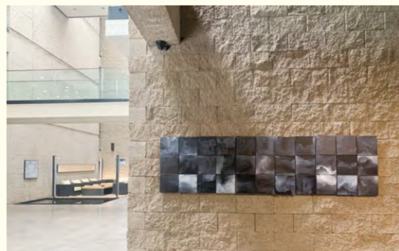
《灰·墨》(丙烯、蜡)20×20cm×33张 2016年 李勇