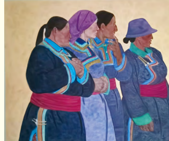
那达慕上的妇女们(水彩)110×150cm 孙元芳