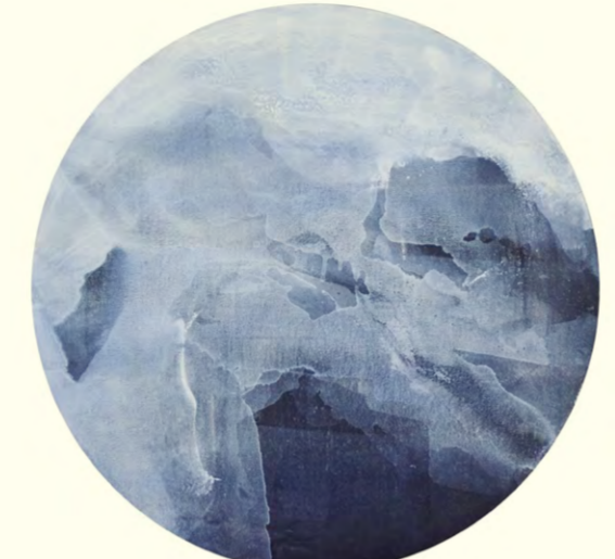
《灰·氐鱼》(丙烯、油、蜡)100×100cm 2015年 李勇