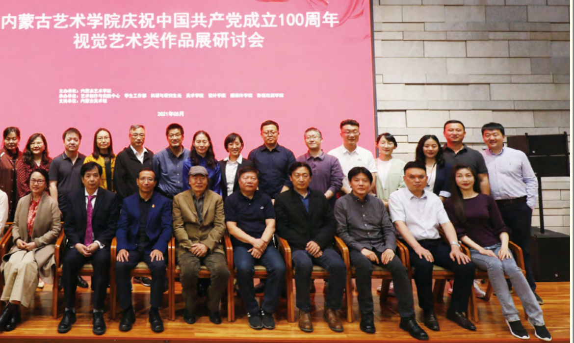
研讨会后,校领导和与会专家、部分老师合影留念 赵殿辉 李杰/文 李光/图