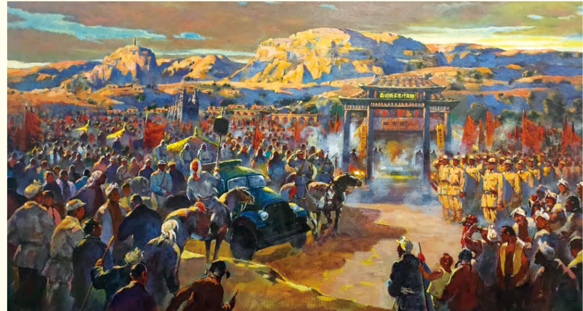
1939年6月21日宝塔山下(油画)55cm×120cm 那顺孟和