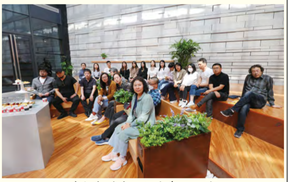
我校相关专业师生参加研讨