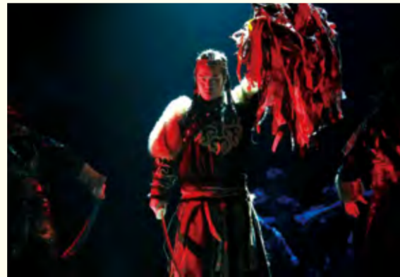
原创民族话剧《英雄·江格尔》演出现场

影视戏剧学院戏剧表演专业,通过扎实的教育教学,不断的科研探索,有序的创作实践,在展演的舞台上,交出了一份完美的答卷。今后,他们希望通过创作更多充满正能量的作品,教育并影响学生,将立德树人落到实处,推进将戏剧影视表演专业发展到一个新的高度!