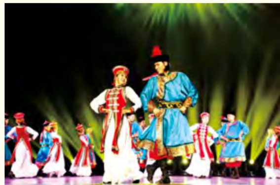
舞蹈表演专业民族民间舞演出现场