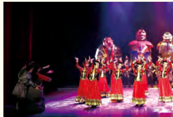
原创民族话剧《英雄·江格尔》演出现场