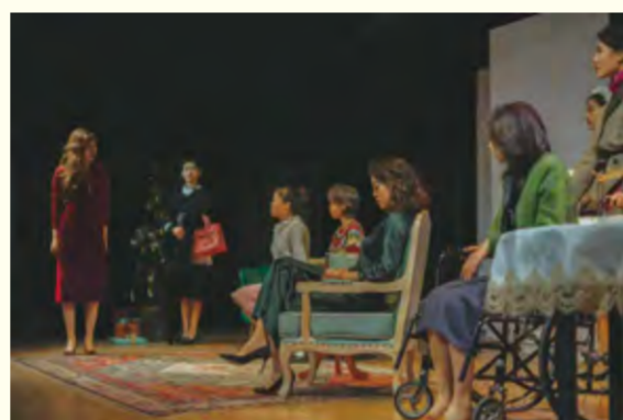
话剧《八个女人》演出现场