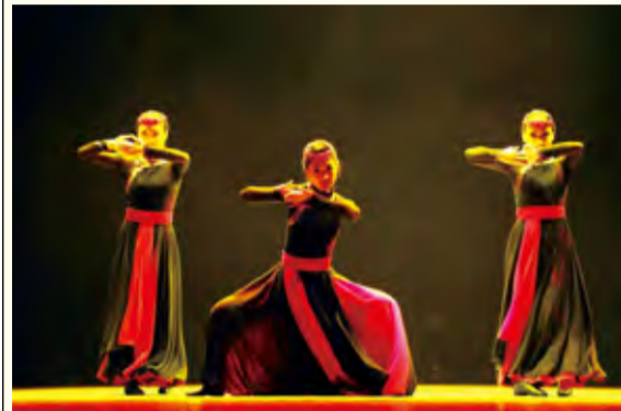
舞蹈编导班演出现场