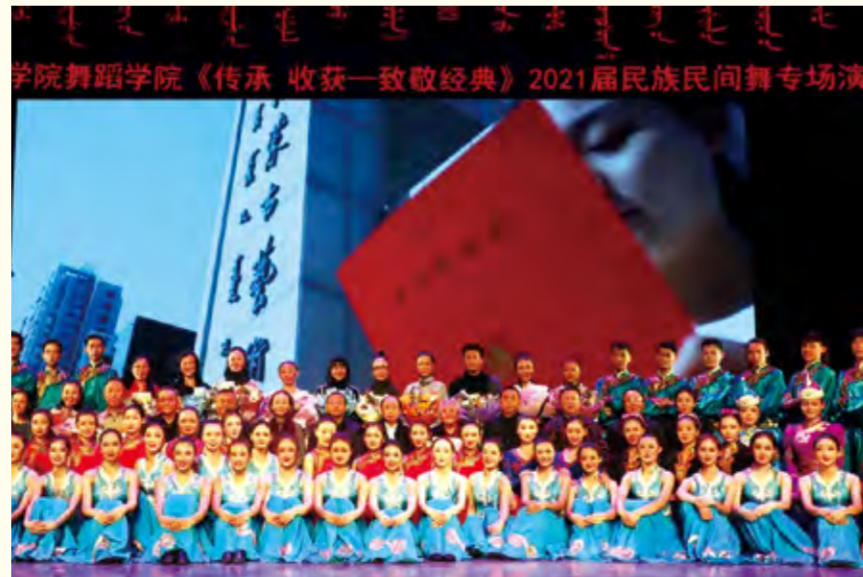
舞蹈表演专业民族民间舞演出后合影