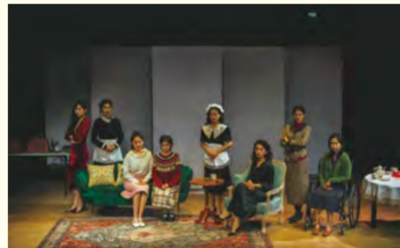
话剧《八个女人》演出现场