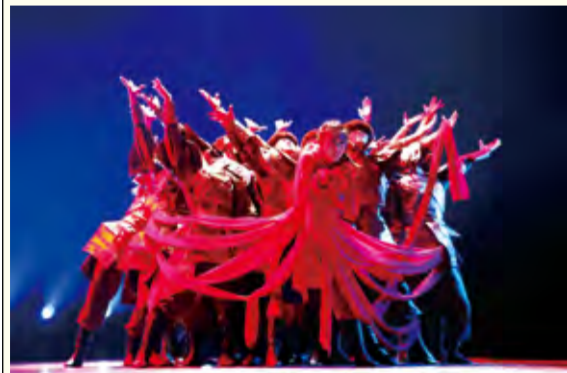
舞蹈编导班演出现场