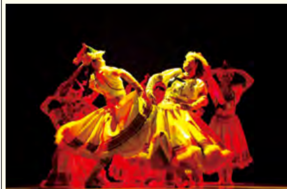
舞蹈编导班演出现场