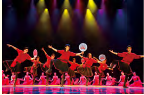
舞蹈表演专业民族民间舞演出现场