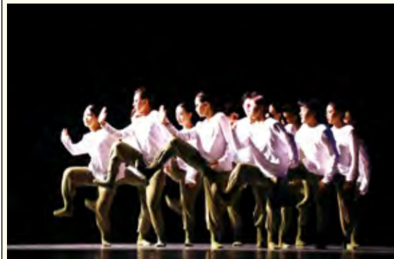
舞蹈编导班演出现场

《“传承 收获——致敬经典”2021届毕业生民族民间舞专场晚会》,由基本功、蒙古舞、民族民间舞、剧目四个部分组成。基本功是舞蹈表演的基础,通过四年的训练,学生身体的控制力有了极大提高,在舞台上展示了各种高难度技术技巧组合。蒙古舞历经千年传承,生生不息,既柔和优美,又刚硬挺拔,《顶碗舞》《盅舞》《筷子舞》《安代舞》很好诠释了蒙古舞的这些特点。民族民间舞部分集中展示了藏舞、维吾尔族舞、朝鲜舞和东北秧歌四种风格性组合。传统剧目《鄂尔多斯》之后是个人剧目串烧,将晚会推向高潮。大气磅礴、民族特色浓郁的群舞《心中的歌儿献给党》作为压轴节目引爆了全场观众的热情。舞蹈学院2021届舞蹈表演专业41名毕业生用过硬的专业素质和高质量的舞蹈表演,展示了他们四年的学习成果。