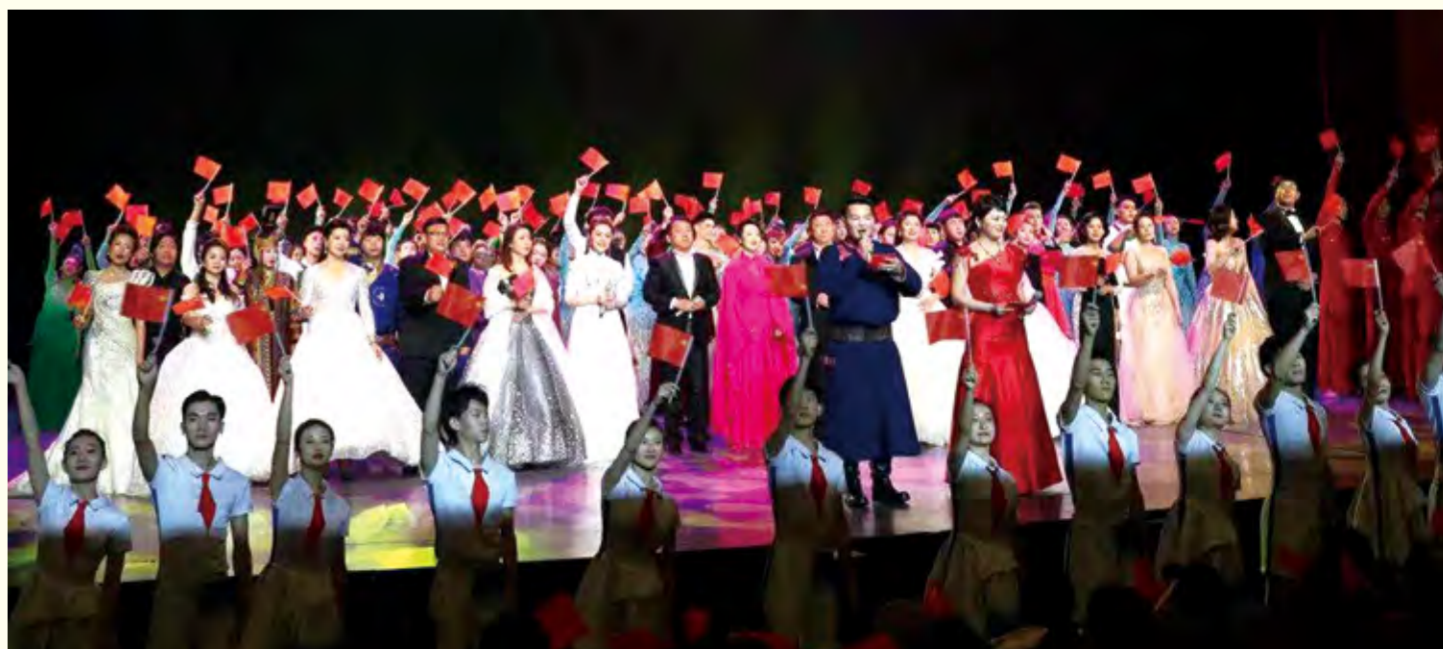
毕业生就业洽谈会开幕式演出现场

测量体温,分批分次通过安检放行进入招聘现场的措施,还专门在就业洽谈会现场设置了医疗防疫点,要求参会单位代表、应聘学生及工作人员全程佩戴口罩,确保了疫情防控常态化条件下的校园招聘工作的有序开展。学校领导及用人单位代表亲临招聘会现场,