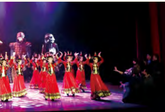
原创民族话剧《英雄·江格尔》演出现场