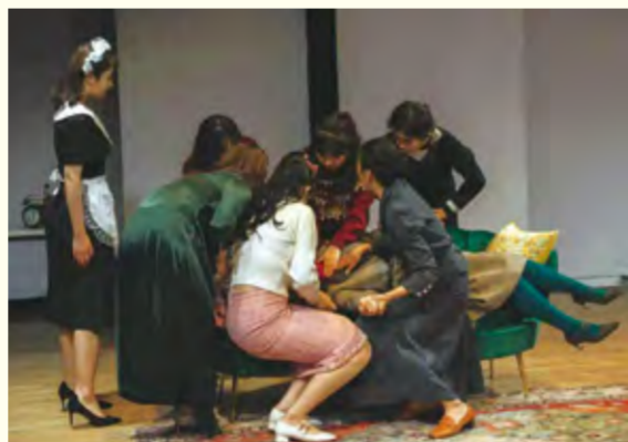
话剧《八个女人》演出现场