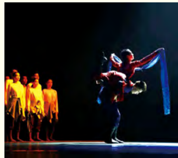
舞蹈表演专业民族民间舞演出现场