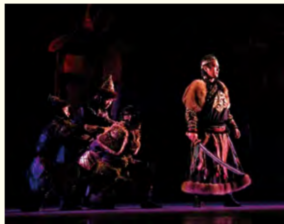
原创民族话剧《英雄·江格尔》演出现场