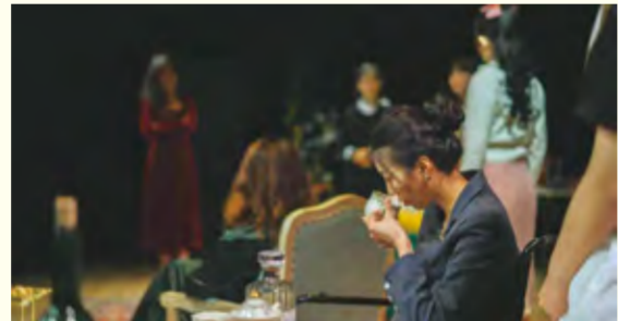
话剧《八个女人》演出现场