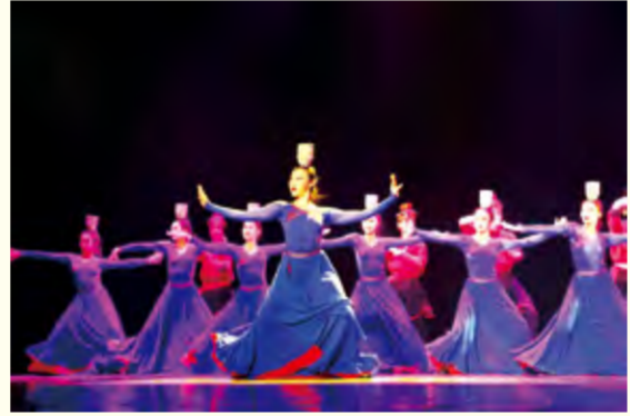
舞蹈表演专业民族民间舞演出现场