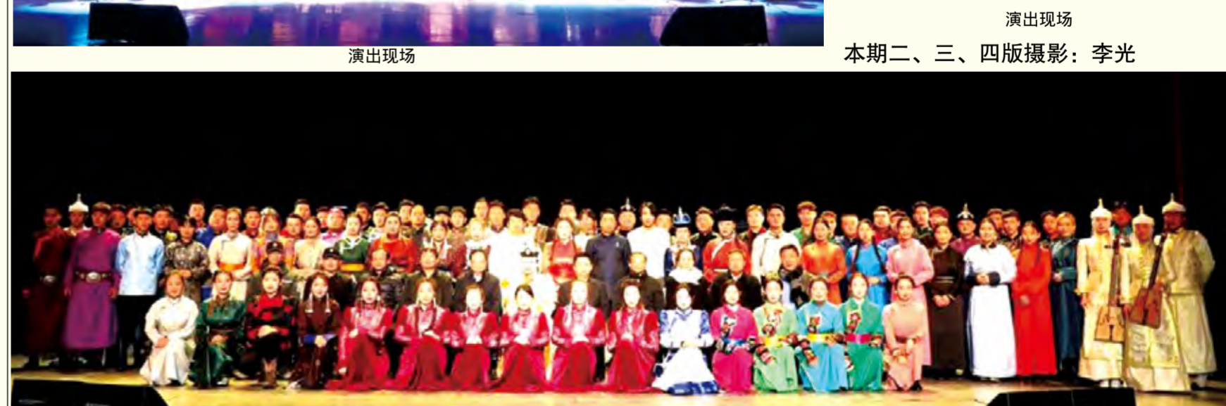
音乐学院毕业生展演演出后合影