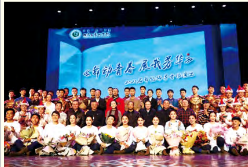
舞蹈编导班演出后合影