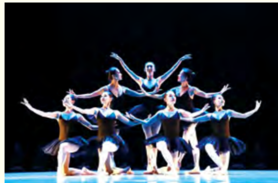
舞蹈表演专业民族民间舞演出现场