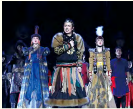
原创民族话剧《英雄·江格尔》