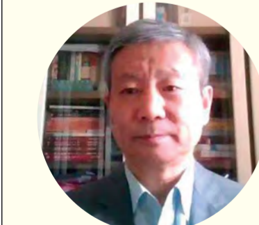
中国艺术学理论学会副秘书长田川流教授